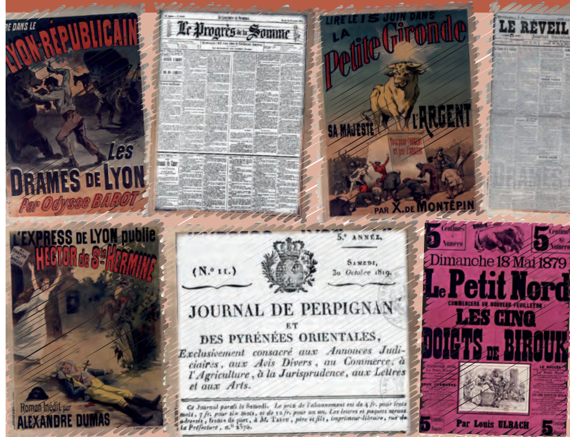
■ Conception réalisation : Direction de la communication UPJV ■ Impression : Repro-Campus